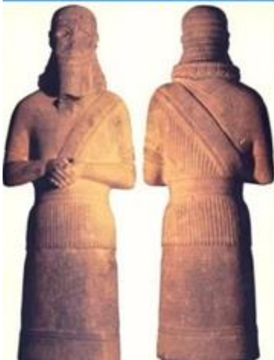
敘利亞王像 (Tell Fakhariy