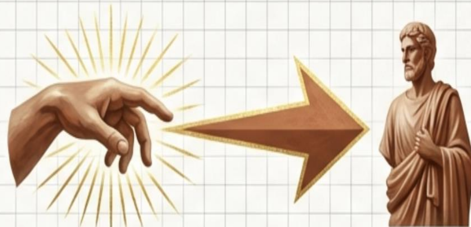
Path B (Humans)